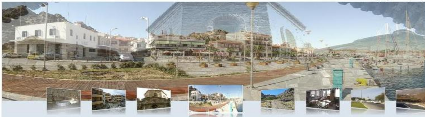
Περιφέρεια Βορείου Αιγαίου | Χάρτης Β.Α. | Επικοινωνία